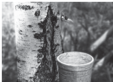
Добывание березового сока