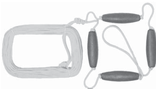
Метательная веревка, или «конец Александра»