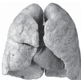
Легкие здорового человека