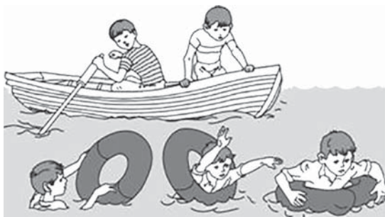
Оказание помощи спасательным кругом

— Посмотрите на картинки и скажите, какой спасательный инвентарь используется и в каких случаях им можно пользоваться?