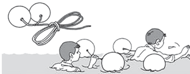
Оказание помощи спасательными шарами