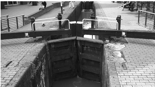
Шлюз у Англіі

У свеце ўсяго тры такія каналы: Каледонскі ў Вялікабрытаніі, Гота ў Швецыі і Аўгустоўскі на тэрыторыі Польшчы і Беларусі.