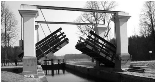
Развадны мост на Аўгустоўскім канале

Адным з галоўных шлюзаў на Аўгустоўскім канале лічыцца шлюз Дамброўка, пабудаваны ў XIX ст. Знешне ён вельмі прыгожы, бо складаецца з масіўных варотаў і разваднага моста, а значыць, канал можна перасякаць як сухапутным транспартам, так і па вадзе.